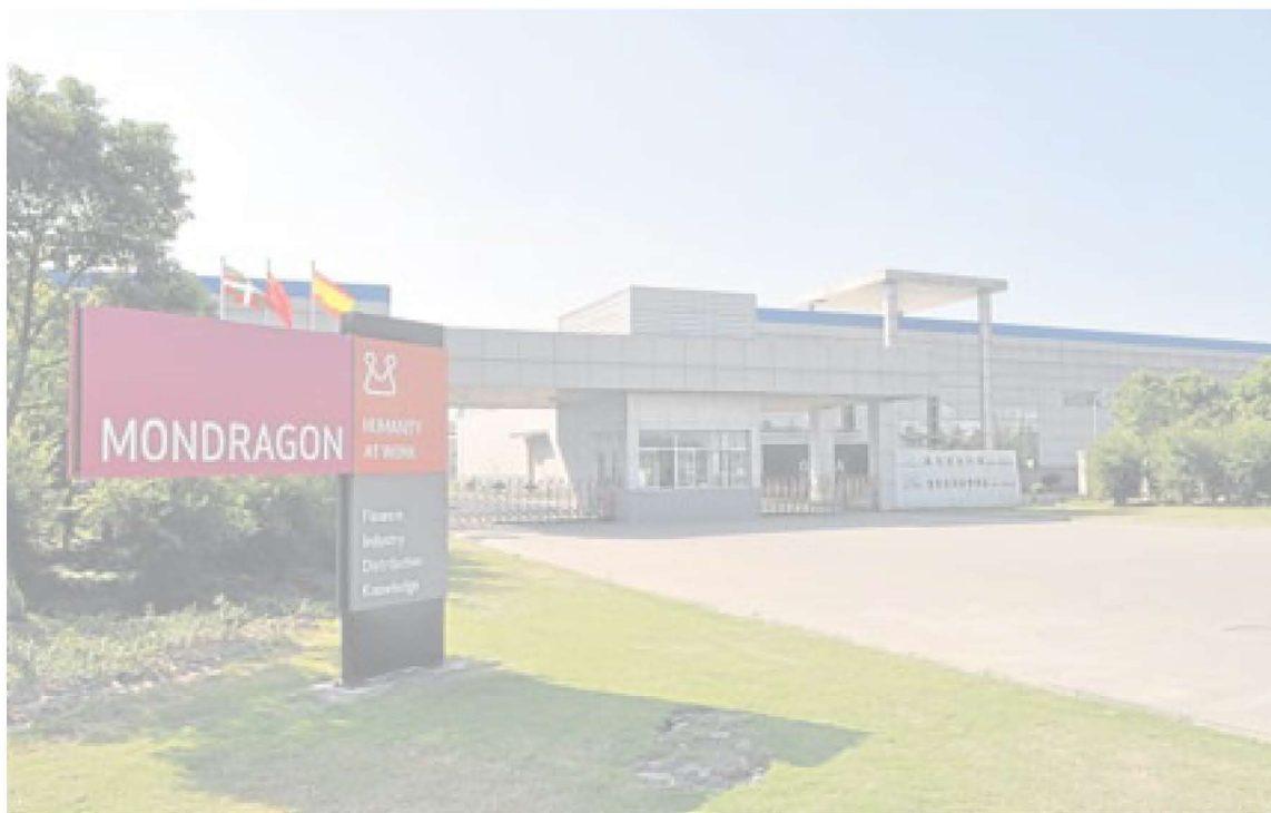
Entrada al enorme polígono industrial de Kunshan, propiedad de la Corporación Mondragón.

Así las cosas, y cuando muchos –también en Mondragón, como pueda ser Orbea– salen de China a toda prisa, Copreci ha decidido redoblar su apuesta allí. La compañía, que ya dispone de una planta en el sur del país (en Zhuhai), abrirá una segunda, de unos 3.200 metros cuadrados, en un edificio situado en el parque empresarial que la Corporación tiene en Kunshan. Desde ese emplazamiento le será mucho más cómodo atender a los clientes del área de Shanghai; un mercado que queda a más de 1.600 kilómetros de su actual fábrica.