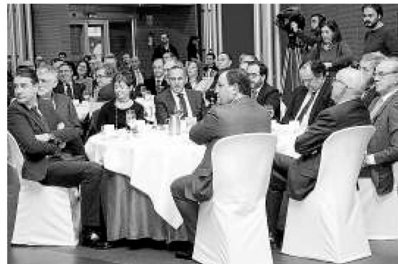
Algunos de los asistentes a la jornada en el Parque Tecnológico.

Euskadi este año se mantenga en la senda del generado en 2015, aunque de manera desigual para los diversos sectores, y que puedan crearse en torno a 18.000 empleos. En este sentido, el presidente de Euskaltel, Alberto García Erauzkin, destacó que pese a los datos objetivos positivos de la economía en general, la percepción de la situación es negativa “y en economía la percepción suele superar a la realidad”: “Tenemos que dedicarnos a lo nuestro y esperar a que amaine el temporal global”, apuntó, para hacer posteriormente una defensa de proyectos y desarrollo económico equilibrados entre los territorios de la CAV y diversificados en cada uno de los territorios. – M.I.